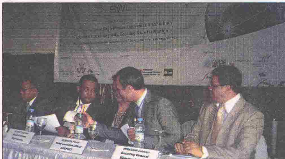
Les officiels, lors de l'ouverture de la Conférence internationale sur les guichets uniques.

"Plus loin dans la facilitation des échanges avec l'interconnectivité des systèmes". Tel est le thème choisi cette année pour la troisième édition de la conférence internationale sur les guichets uniques électroniques. Une conférence, qui, comme son nom l'indique, est tourné autour de la facilitation du commerce transfrontalier par le biais de systèmes informatisés et dont le propre est d'accélérer le processus et de réduire les coûts des échanges. Sur ce point, justement, Madagascar est visiblement en avance, notamment dans le domaine du dédouanement